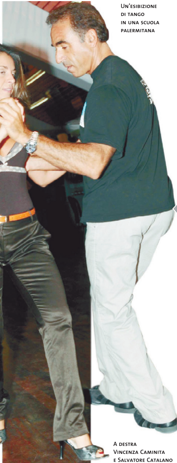
UN'ESIBIZIONE DI TANGO IN UNA SCUOLA PALERMITANA